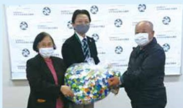
明治安田生命平戸営業所Kizna委員会 7.5kg

明治安田生命平戸営業所Kizna委員会、津吉保育所よりペットボトルキャップの寄贈がありました。寄贈されたペットボトル